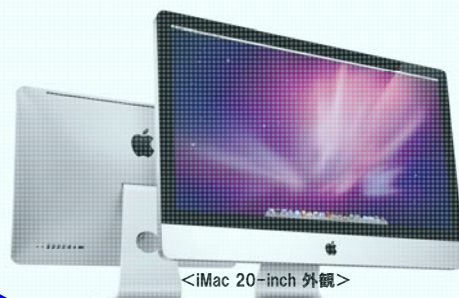
<iMac 20-inch 外観>

次期システムでは全端末にiMac 20-inchを導入します。動画や写真・音楽などの編集に優れており、スリムな筐体ながら機能性も備えています。