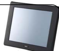
<パネルコンピュータ/12PNC-W2 外観>

プリンタでデータを出力する前に、プリンタの横に設置されたタッチパネルで何を印刷するのか 再確認 ！